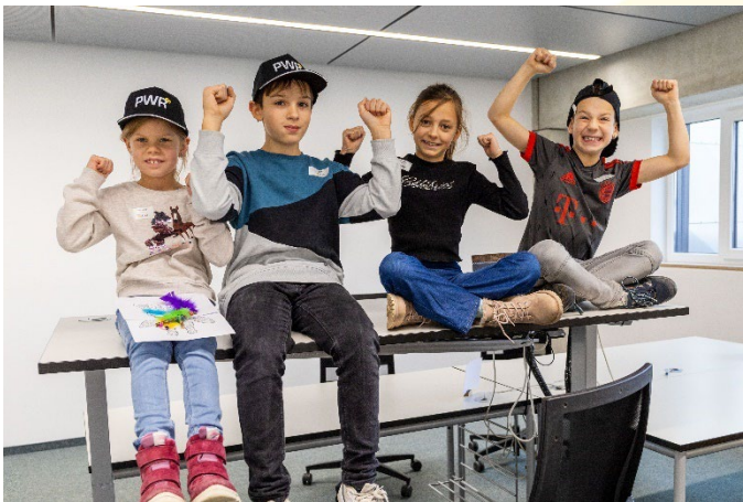
Geschafft, der Arbeitsplatz wurde erfolgreich inspiziert und übernommen.