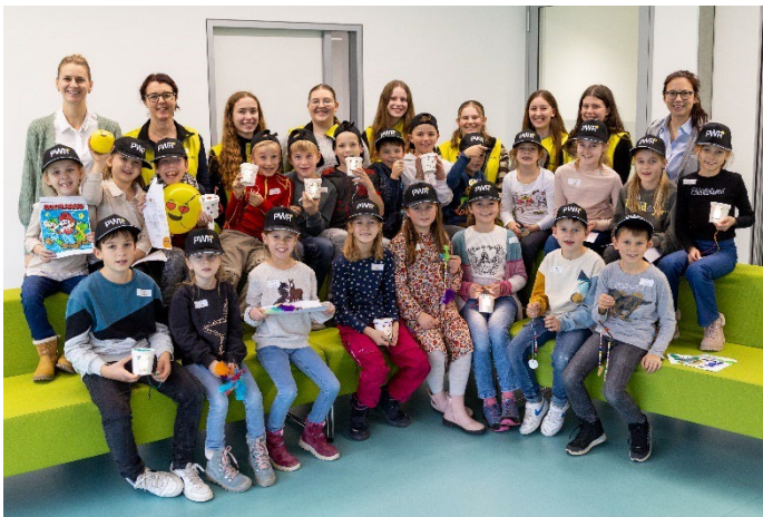
22 Kinder mit ihrem Betreuersteam am Spangler Kids Day.

Darüber hinaus übernimmt SPANGLER die Inbetriebnahme und den After-Sales-Service der Anlagen.