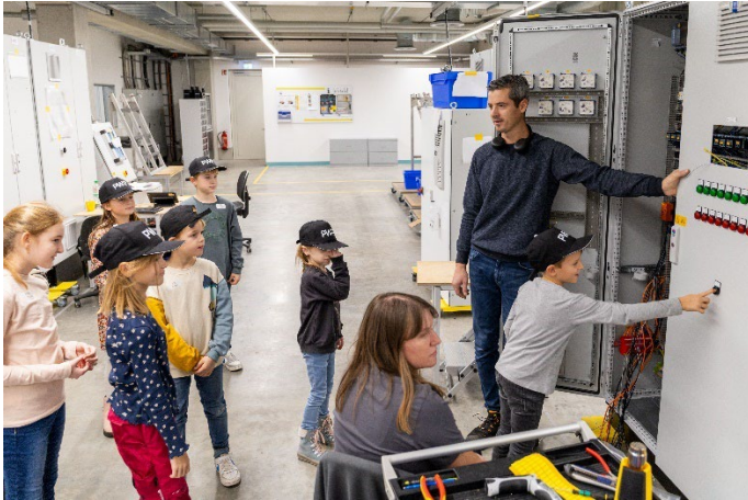
Erste Einblicke in die tägliche Arbeitswelt.