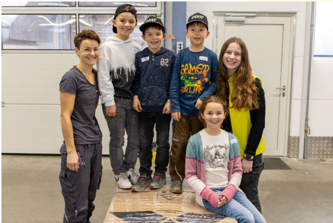
Viele spannende Arbeitsplätze mussten erkundet werden.