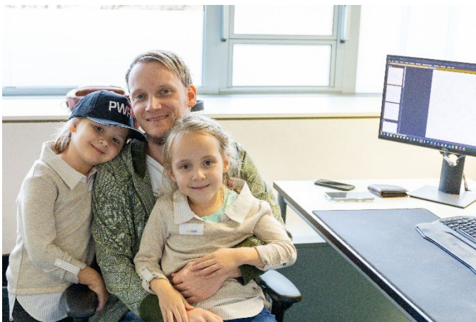
Mama und Papa am Arbeitsplatz besuchen konnten 22 junge Schüler.